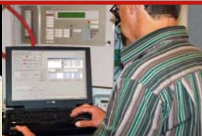
IN GEBRUIK STELLEN