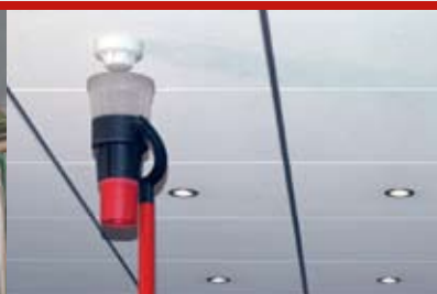
SERVICE EN ONDERHOUD